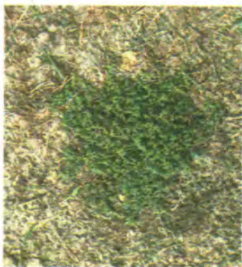
552. Остудник голий.